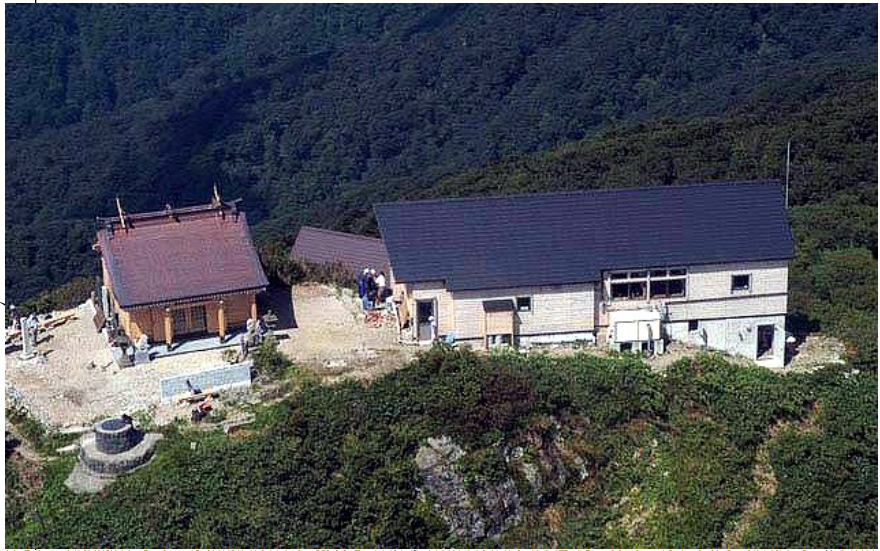
神社と休憩所（左）、奥がトイレ棟。